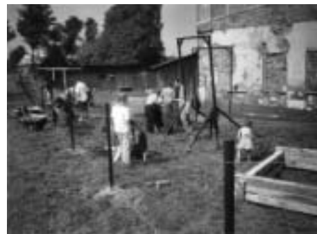
Na celodenní brigádu přišli všichni, kdo slíbili pomoc. Bylo to příjemné překvapení.