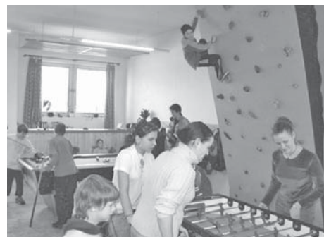
Všední den v T-KLUBU

Odpracuj si 5 hodin a máš celý měsíc zdarma - lezeckou stěnu, stolní fotbal, šipky, kulečnick, stolní tenis, stolní hry a veškeré vybavení klubu. K tomu jako bonus dostaneš vstupenku do kina a dvakrát do měsíce můžeš zadarmo do bazénu!