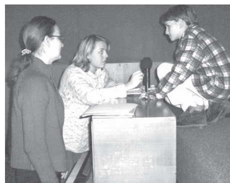
Soutěž Zpěváček Tolštejnského panství, foto: Šárka Pešková

Rada města schválila podmínky pro přiznání příspěvku města na rekonstrukci střech, fasád a oplocení. O příspěvek si může do 15. 3. 2004 požádat každý občan Krásné Lípy vlastníci dům k trvalému bydlení na území města Krásná Lípa. Pravidla pro získání příspěvku jsou zveřejněna na nástěnkách MěÚ. Před zahájením oprav musí stávající stav zhlédnout a posoudit příslušná komise. Formuláře žádosti o zařazení mezi uchazeče o příspěvky si můžete vyvést na odboru výstavby a životního prostředí Městského úřadu v Krásné Lípě — kancelář č. 5 (Zuzana Mausová).