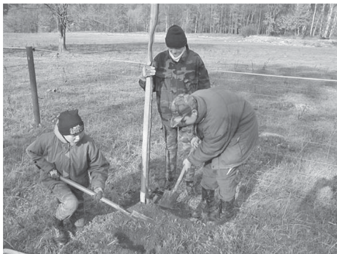
Vysazování bukové aleje při akci Den stromů

pracovník ekologické výchovy, Správa NP České Švýcarsko