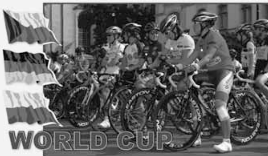
Etapa - JAROVSKÝ ÚJEZD - 102,7 km 4. června 2006 - Start ve 13:00 hodin