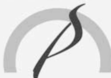
OPS ČESKÉ ŠVÝCARSKO