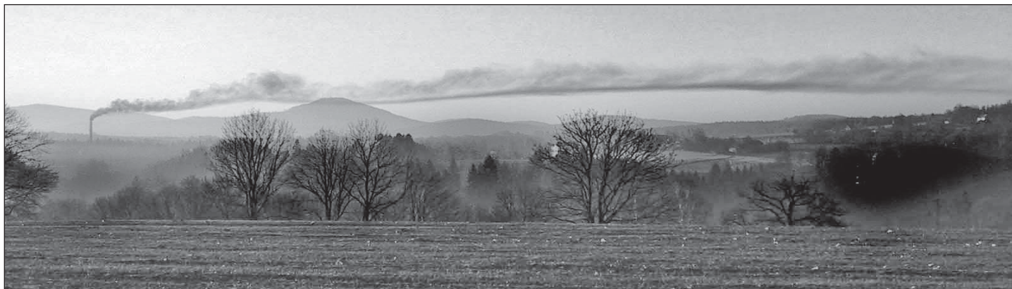
Takto kouřil komín v našem městě desítky let, pod dohledem státních úřadů.