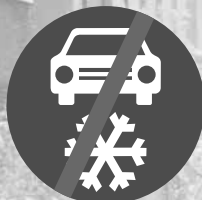
Zimní výbava - konec (č. C 15b)