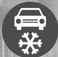
Zimní výbava (č. C 15a)