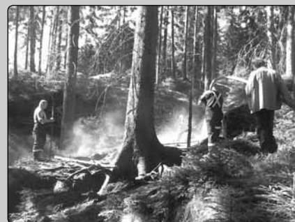
Krásnolipská hasiči při potlačování ohně v NP České Švýcarsko v loňském roce.