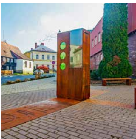
Po 119 letech má Krásná Lípa novou meteostanici