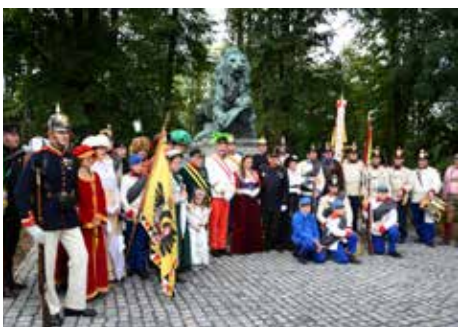
Spolek Komitét 1866 při slavnostním odhalení obnoveného památníku Iva