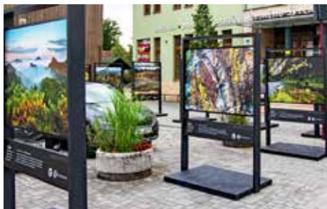
Venkovní výstava uspořádaná Správou NP ČŠ k 20. výročí založení Národního parku České Švýcarsko