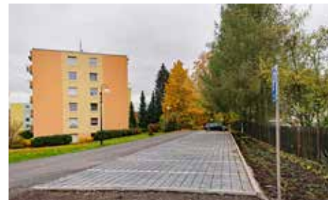
Byla upravena další odstavná plocha tentokrát v Nemocniční ulici