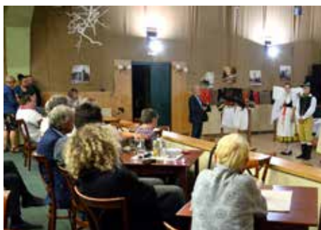
V kulturním domě proběhla přednáška věnovaná českému folkloru