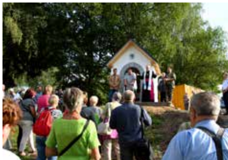
Ve Vlčí Hoře byla vysvěcena znovupostavená kaplička sv. Antonína Paduánského