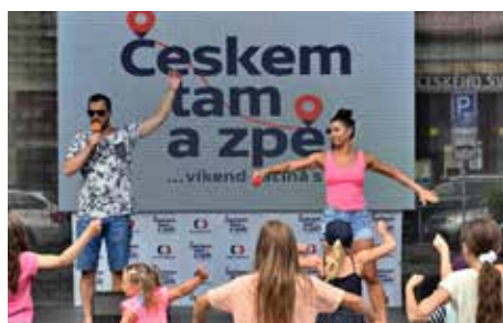
Česká televize vysílala z Krásné Lípy a připravila bohatý celodenní program