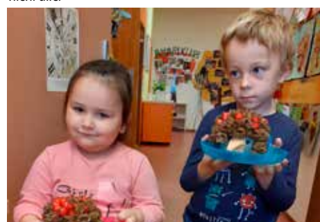
Předškoláci v Klubu Včelka se svými výrobky