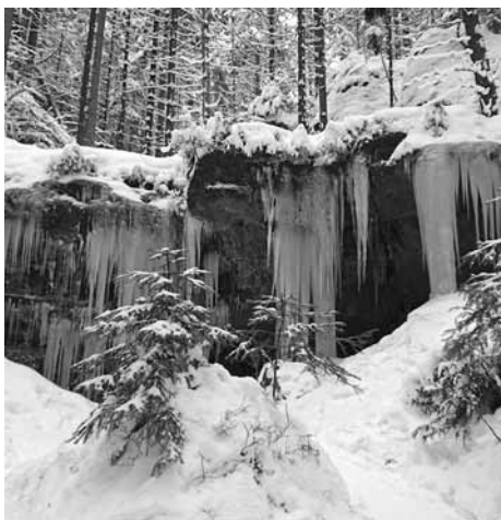
Varhany 13. 2. 2021