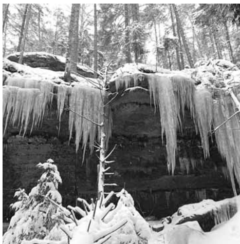
Opona 13. 2. 2021

Když se zima povede, nabízí mnohé, tělu prospívající a oku lahodící. Jedním z takových zimních zázraků jsou i vyhlášené Brtnické ledopády. Výlet na ně potěší nejen oči, ale pobytem v přírodě jistě prospěje i našemu tělu.