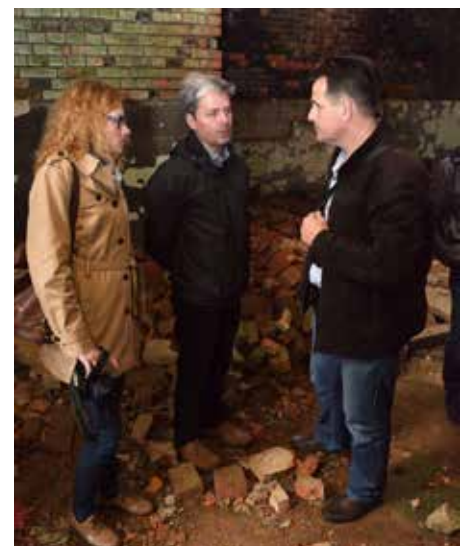
Se zástupci spolku Omnium