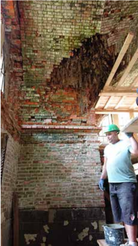
Kořeny stromů prorůstající střechou do klendy

Ve stavu, v jakém jsme hrobku převzali bylo zřejmé, že není času nazbyt a je potřeba urychleně jednat. To znamenalo stavbu staticky zajistit a stabilizovat klenby, aby nedošlo ke zřícení stavby. Až dalším krokem pak bylo zastřešení, neboť objekt již řadu let žádnou střechu neměl a z jejich zbytků vyrůstaly náletové dřeviny. Zastupitelstvo uvolnilo z rozpočtu města částku 2,35 mil. Kč na základní stabilizační práce a současně jsme zahájili průzkumné práce a ve spolupráci se statikem, projektantem a odborníky památkové péče. Urychleně jsme zpracovali projektovou dokumentaci na stabilizaci kleneb a zastřešení, abychom mohli požádat o podporu z dostupných dotačních zdrojů. Je jasné, že záchrana a komplexní rekonstrukce mauzolea nemůže být financována z příjmů města.