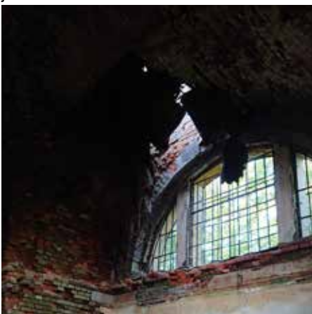
Kritický stav kleneb a stropu - výchozí stav

Protože jsme si dobře uvědomovali nejen architektonickou hodnotu objektu, ale i zásadní význam a hmotný odkaz rodiny Dittrich pro další rozvoj města, rozhodli jsme se jednat o převodu s insolvenčním správcem. Až v roce 2023 přešla hrobka do vlastnictví města Krásná Lípa za symbolických 10 tisíc korun.