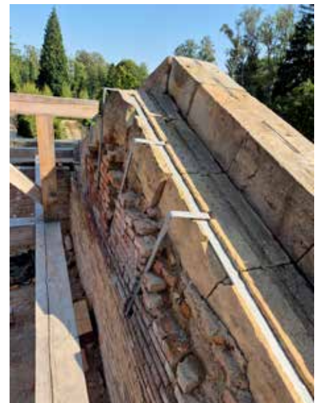
Statické zajištění říms, štítů a kamenného věnce