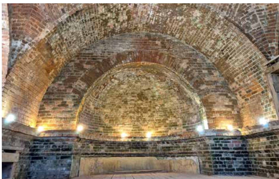
Kompletní sanace kopule hrobky