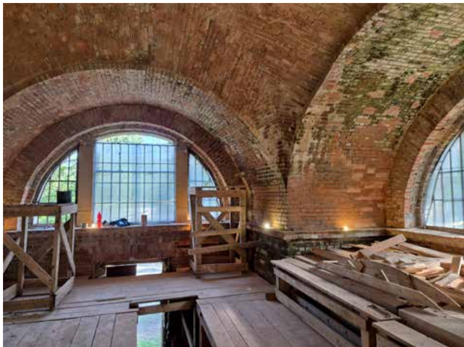
Stabilizace a výsrava zdiva