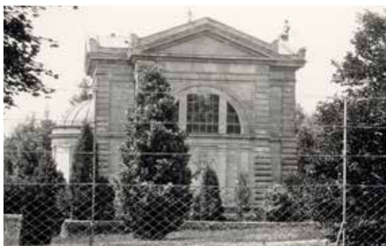
Dobový pohled od silnice směr Doubice