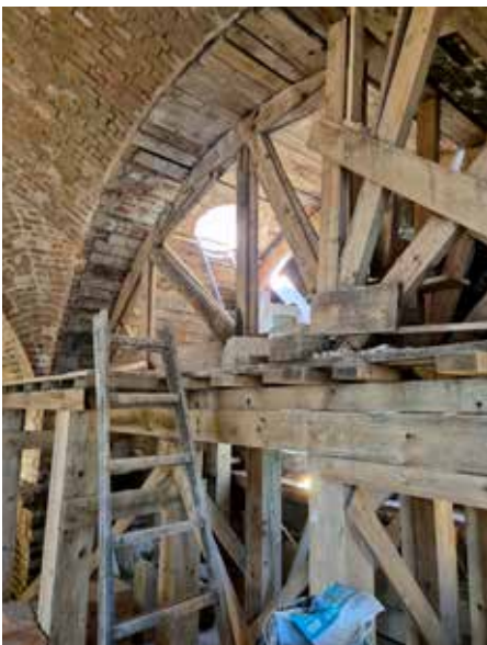
Stabilizace a zajištění kleneb