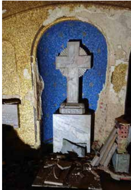
Unikátní mozaiková výzdoba v podzemní kryptě