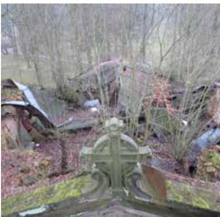
Pohled na zbytky střechy - výchozí stav