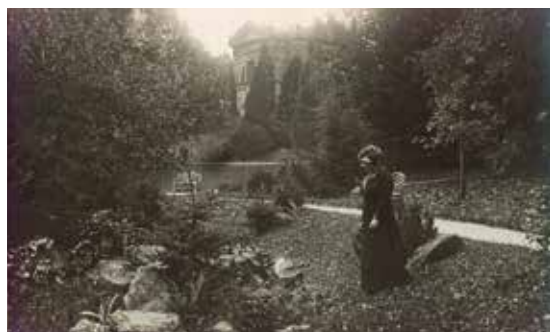
Historických fotografií hrobky se mnoho nedochovalo, zde pohled od rybníka Oko