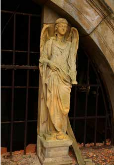
Figurální výzdoba vstupní strany hrobky

let později, jako soukromé rodinné mauzoleum, ale zároveň také jako prostor pro zádušní mše. Architekt Raschdorff navrhl stavbu, výzdobu připravil místní malíř August Frind. Hrobka měla vlastní kotelnu pro vytápění během obřadů a již v roce 1894 byla elektrifikována. Podzemní krypta je vyzdobena unikátní rozsáhlou skleněnou mozaikou evropského významu.