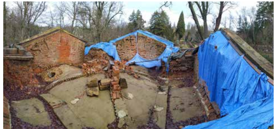
Celkový pohled po vyčištění