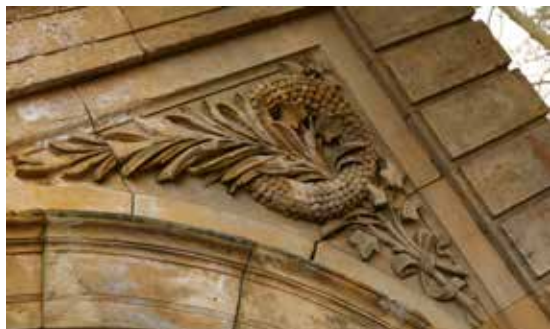
Fragmenty z pískovcového pláště objektu