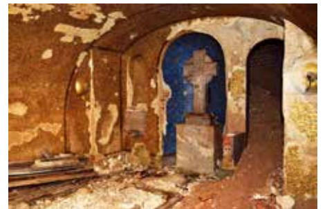
Pokročilá destrukce v podzemní kryptě - výchozí stav