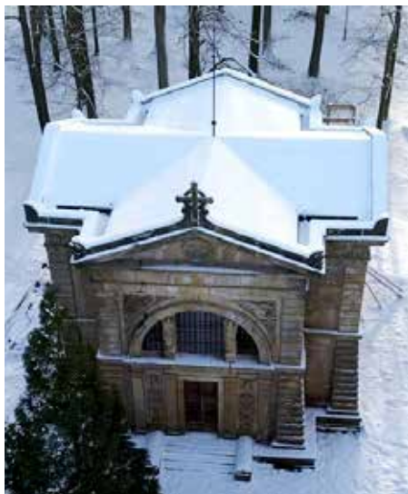
Hrobka s novou střechou