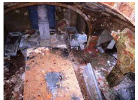
Pohled do krypty shora