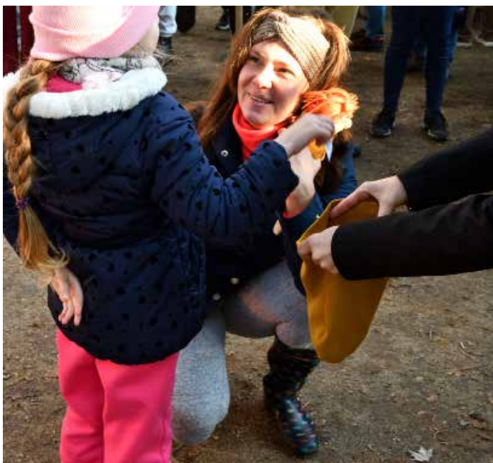
Proběhlo losování čísel určujících, který strom kdo zasadí