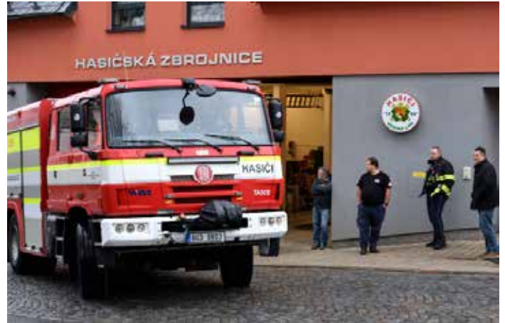
Slavnostní výjezd nového hasičského vozu ze zbrojnice