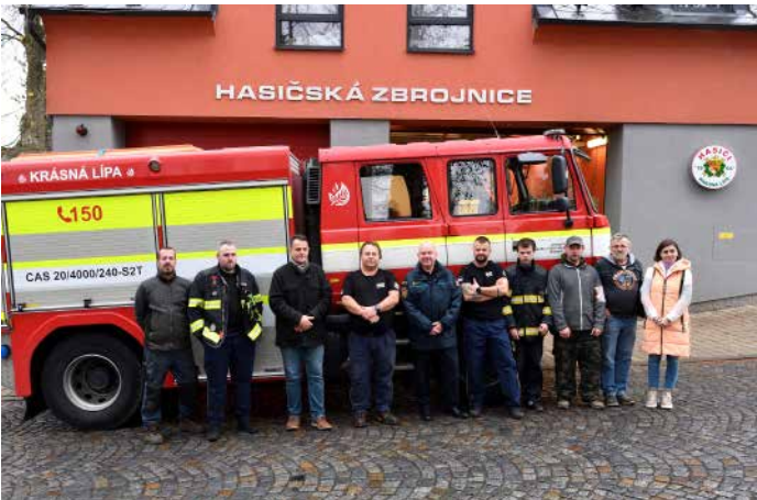
Společná fotografie u nového hasičského vozu (vedení města, zástupci místních hasičů a ředitel HZS územního odboru Děčín)