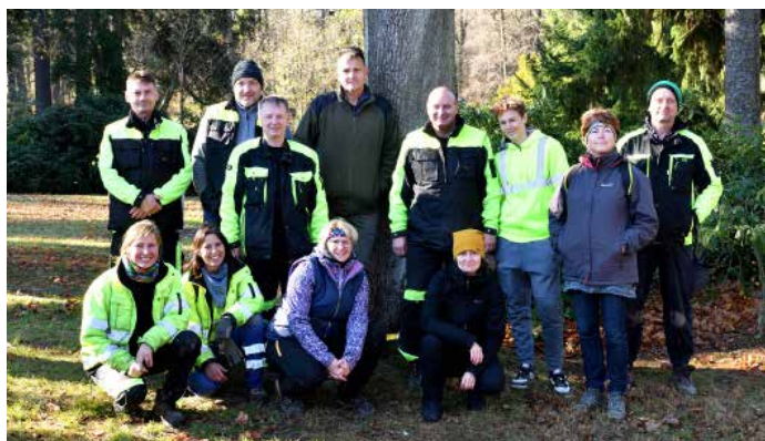
Poděkování pracovníkům technických služeb, vedení města a vedoucí kulturního domu Krásná Lípa za skvělou organizaci a pomoc při výsadbě stromů