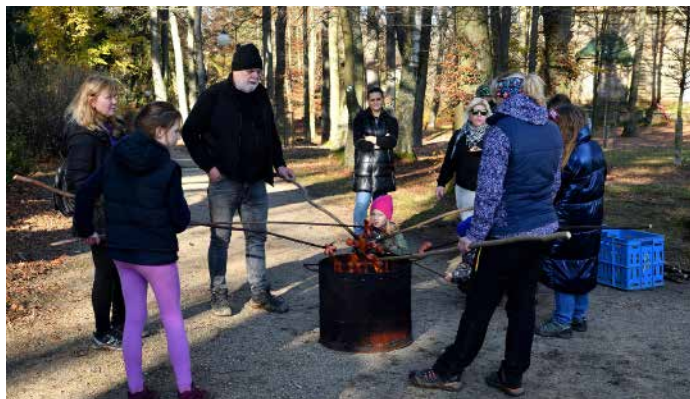
Pro všechny účastníky bylo připraveno opékání buřtů, teplý nápoj a sladký dezert