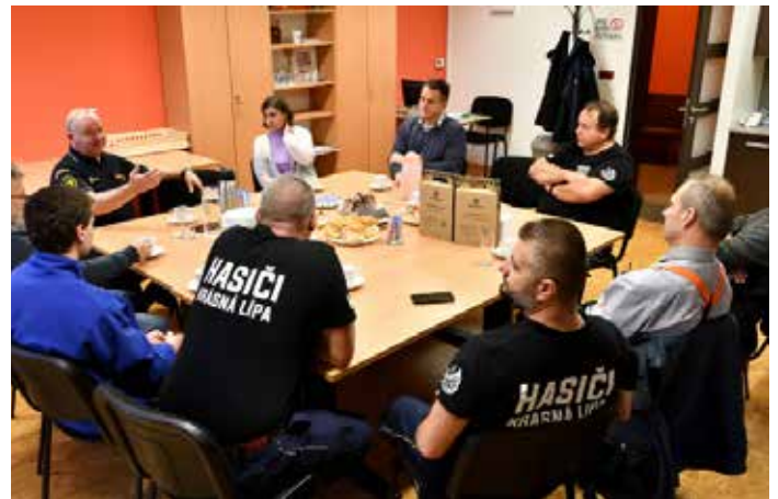
Přátelské posezení s diskuzí, poděkováním hasičům a sdílením plánů do budoucna.