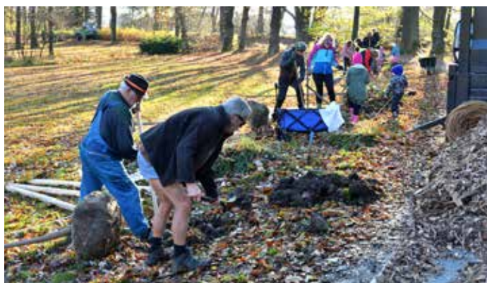
Občané společně vysazují stromy, práce šla všem od ruky