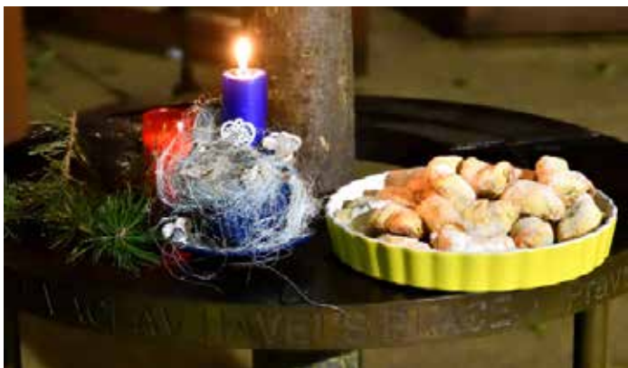
Tradiční Pietní setkání u Lavičky Václava Havla