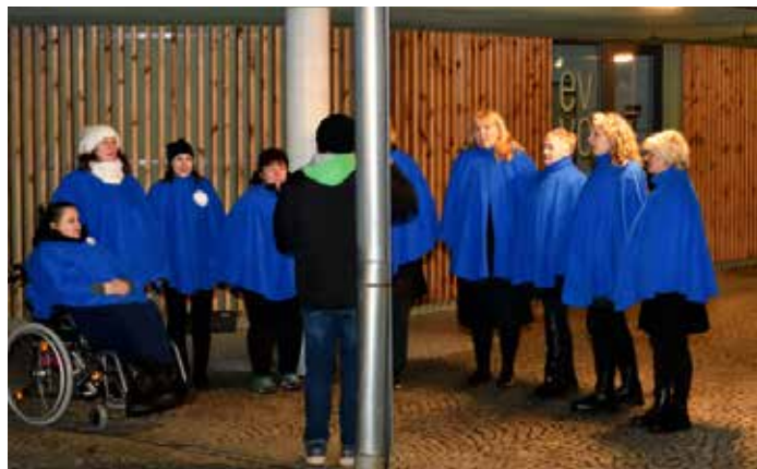
O hudební vystoupení se tradičně postaral Krásnolipský komorní sbor