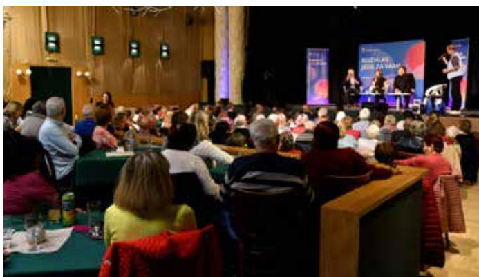
Kulturní dům zaplněn, děkujeme za hojnou účast