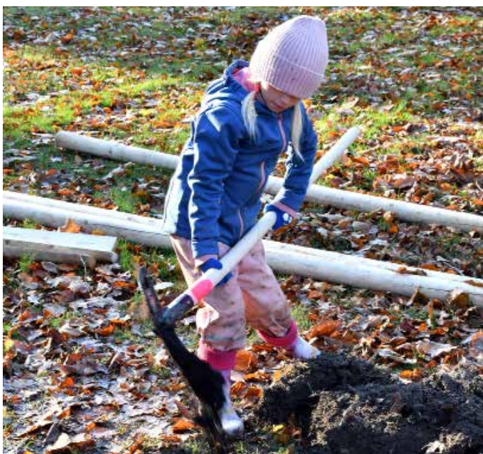
Jedna z mnoha pomocnic, která s rodinou poctivě položila ruku k dílu