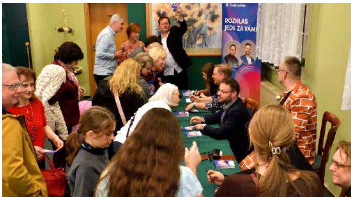
Nechyběla ani autogramiáda