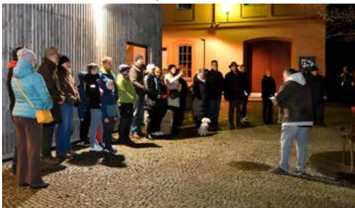
Slavnostní proslov spisovatele a dramatika Rostislava Křivánka