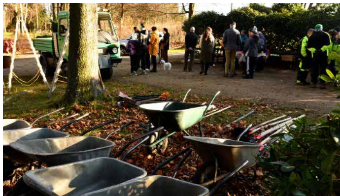
Od technických služeb připraveno nářadí pro občany na sázení stromů