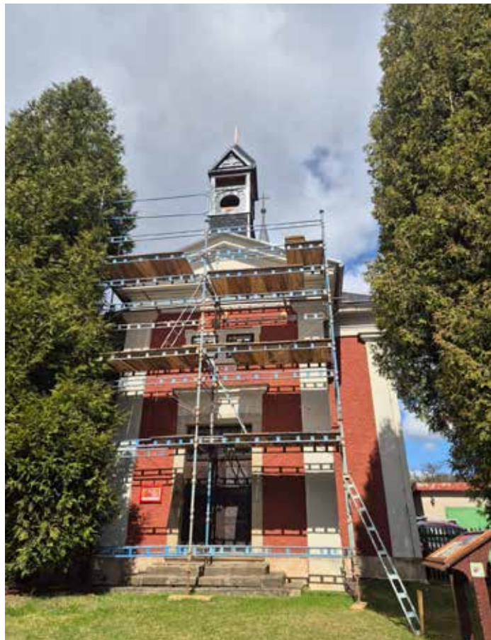
Věžička je zpět na svém místě.