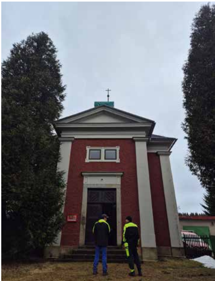
Technické služby dokončili opravu věžičky na kapličky ve Vlčí Hoře.