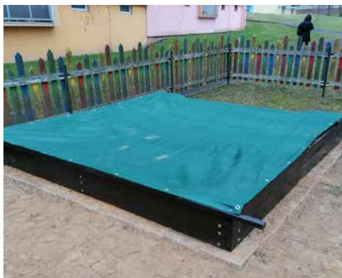
K jarním pracím našich TS patří úpravy dětských hřišť, mj. i čištění herních prvků. V tomto případě u parkoviště ve Vlčí Hoře.