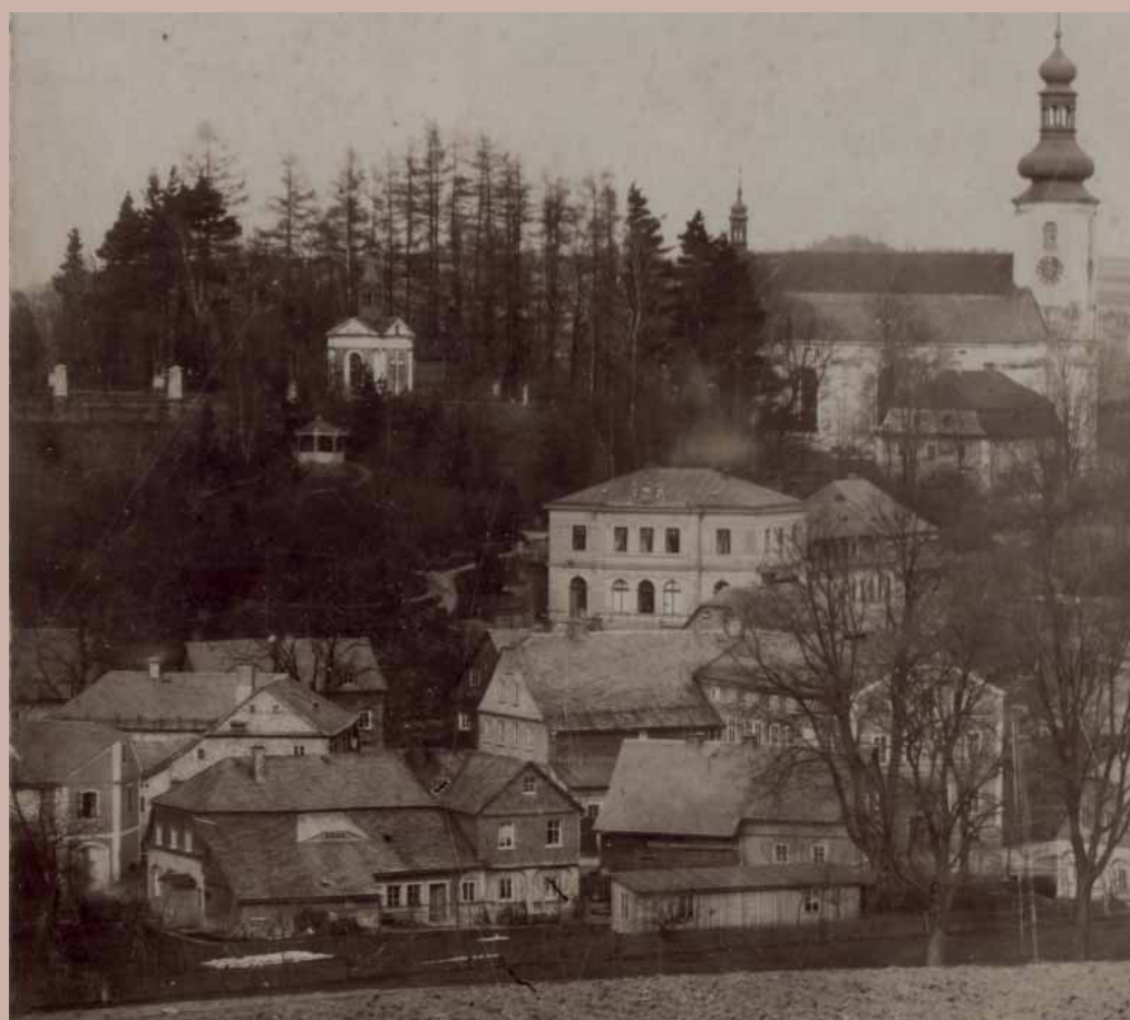
Pohled na křížovou cestu / Blick auf den Kreuzweg

(Maschke), die Statue Ecce homo schuf im Jahre 1886 der Schönlinger Bildhauer Leopold Zimmer. In das Interieur der Kapelle Kalvarien malte im Jahre 1894 A. Frind das Altarbild „Die Beweinung Christi“, dank der finanziellen Mitteln von Frau Theresie Dittrich. Der Kreuzweg wurde in der zweiten Hälfte des 20. Jahrhunderts demoliert, die Kapellen wurden abgerissen, die Kreuzwegstationen auch.