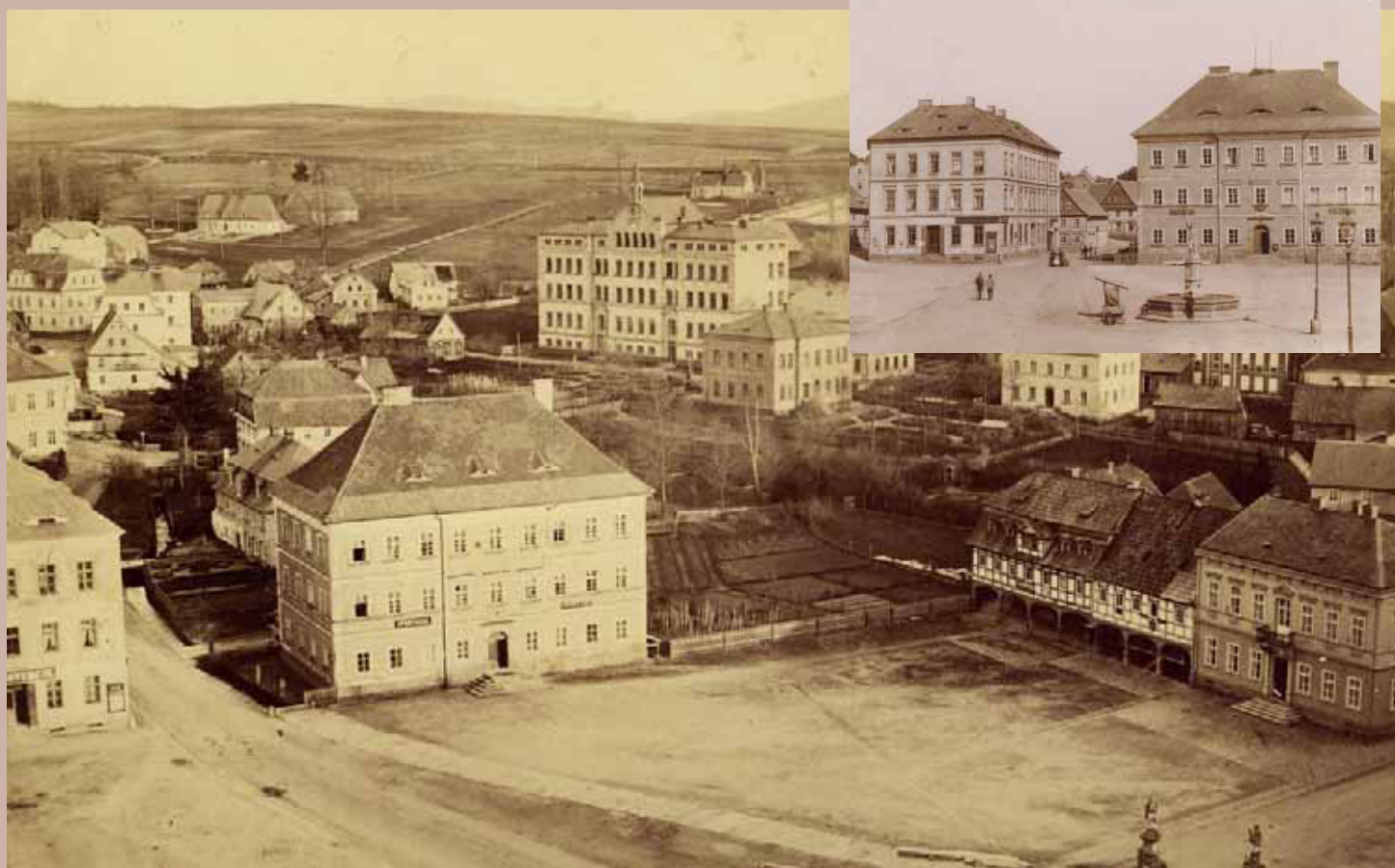
Pohled na obecnou školu / Blick auf die Hauptschule