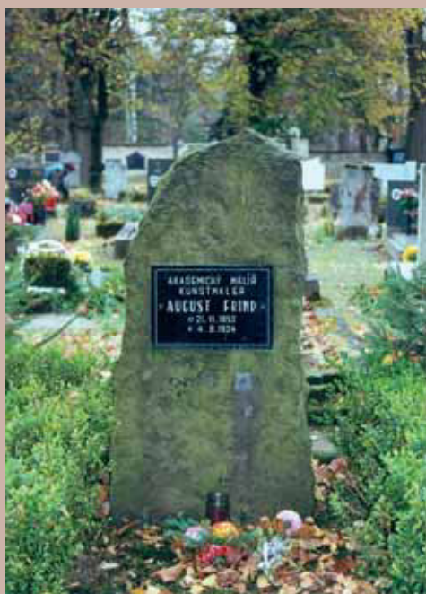
Symbolický hrob / Symbolisches Grab